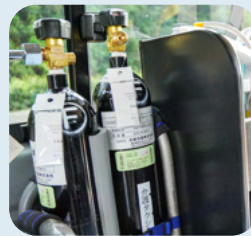
医療用酸素ボンベ

他にも殺菌灯空気洗浄器、プラズマクラスター、心電計も完備しており徹底した安全への対策を行っております。