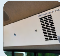
殺菌灯空気洗浄器