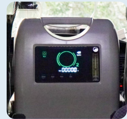
医療用酸素代替酸素生成器